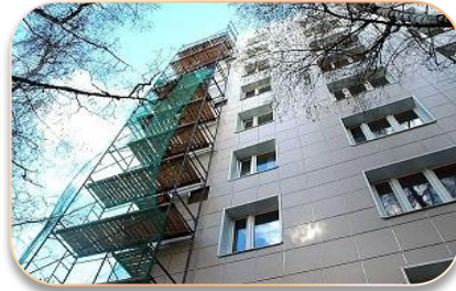
Энергоэффективный капитальный ремонт зданий