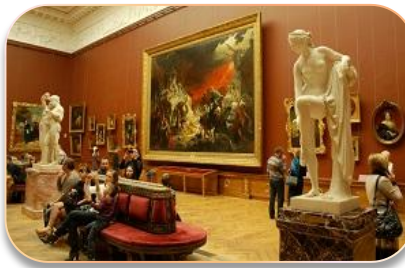
Музеи и хранилища музейных фондов