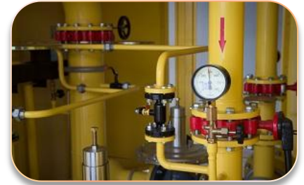
Модернизация газового хозяйства