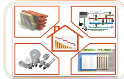
Реализация энергосервисных контрактов в Москве