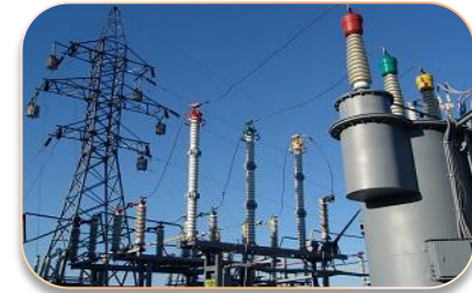
Электроэнергетика и электротехника. Интеллектуальные сети Smart Grid