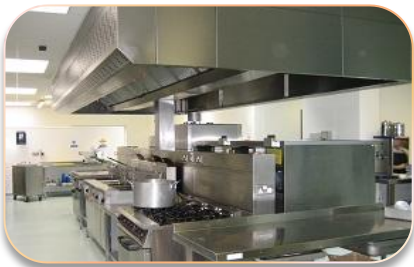
Горячие цеха предприятий общественного питания