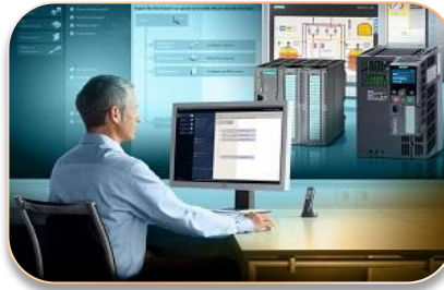
Автоматизация и диспетчеризация. Умный дом. Умный город