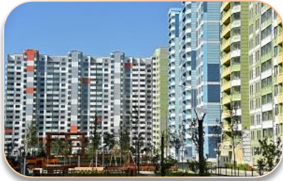
Реновации жилья. Энергоэффективное домостроение