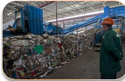
Энергоресурсы из твердых бытовых отходов