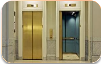
Вертикальный транспорт для жилых и общественных зданий