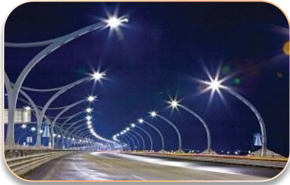
Уличное освещение и световое оформление зданий и сооружений