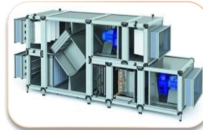
Вентиляция и кондиционирование воздуха жилых и общественных зданий