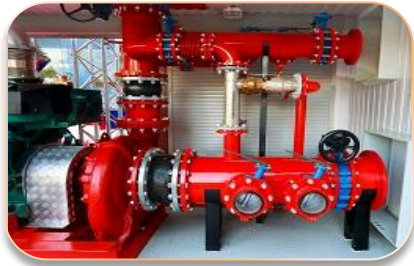
Пожаробезопасность и противоподымная вентиляция