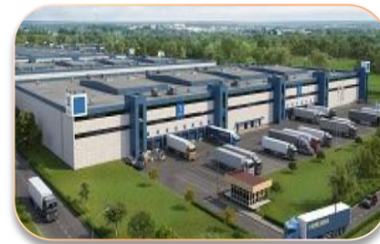
Склады и логистические комплексы