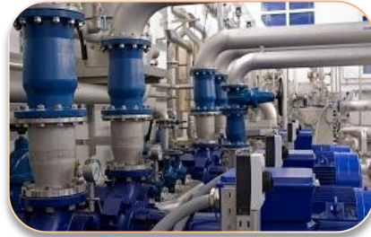
Водоснабжение и канализация