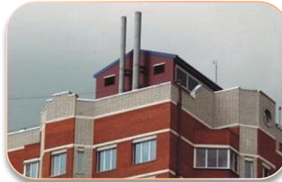
Автономные и индивидуальные системы теплоснабжения