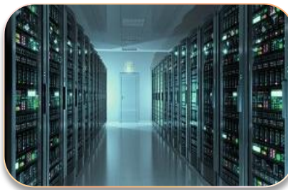
Дата-центры (центры обработки данных)