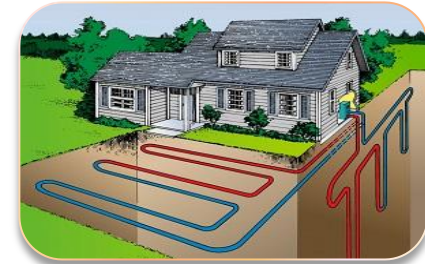
Альтернативные и возобновляемые источники энергии в строительстве и ЖКХ