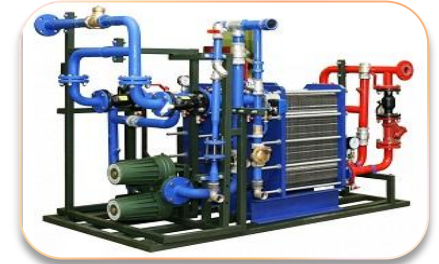
Учет и регулирование потребления энергоресурсов. Модернизация тепловых пунктов