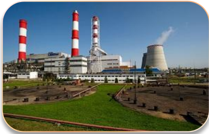
Источники централизованного теплоснабжения и тепловые сети