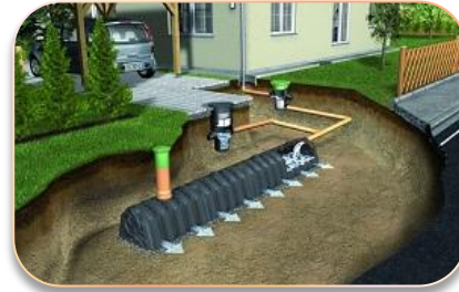
Системы водоотведения поверхностных вод