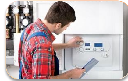
Энергоэффективная эксплуатация объектов недвижимости