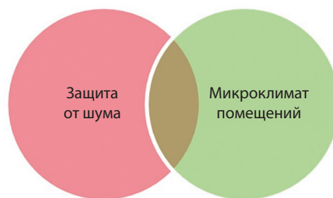
Рис. 1. Защита от шума и микроклимат помещений – в сфере безопасности (диаграмма Венна)

Для системной оценки микроклимата помещений и защиты от шума необходимо проведение акустического и теплотехнического расчетов конструкций полов. Но на