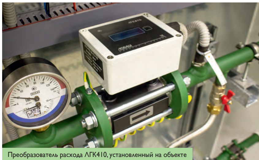
Преобразователь расхода ЛГК410, установленный на объекте

Расходомер ждали. И это вполне объяснимо, поскольку его достоинства говорят сами за себя: ЛГК410 учитывает расход жидкости как в прямом,