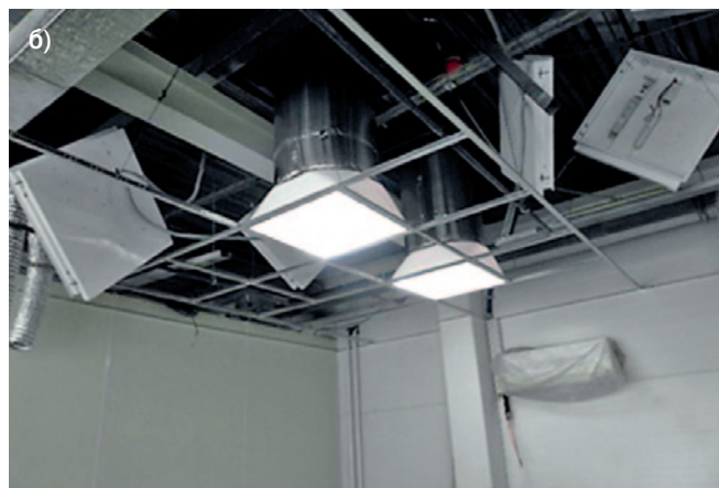
Рис. 2. Работа световодной системы в пасмурную зимнюю погоду (Ярославль, 15 января, 16:00): а) вид снаружи; б) вид изнутри помещения