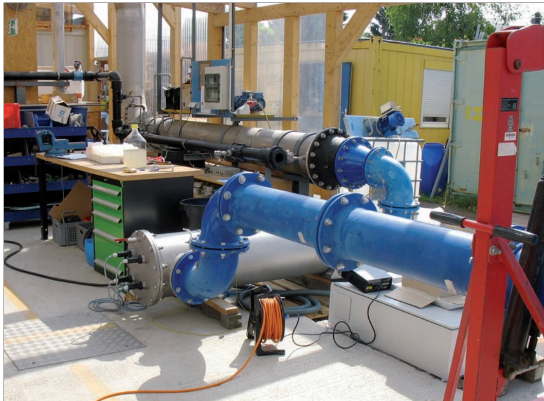
Рис. 3. Стенд биовалидации системы корпусного типа

датчик УФ-интенсивности), которые гарантируют эффективность обеззараживания за счет постоянного мониторинга основных технических параметров, обеспечивая бесперебойную работу и возможность своевременного устранения неполадок. Гарантией эффективного обеззараживания и высокого качества самого оборудования в целом является прохождение реального биотестирования.