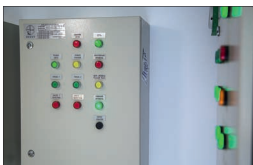
Рис. 3. Мобильное очистное сооружение – вид изнутри

Уже через две недели после запуска очистного сооружения станция вышла на заявленный режим. Очищенные сточные воды жилого комплекса в пригороде Ярцева пригодны к повторному использованию в качестве технической воды. Например, без риска испортить элементы автомобиля мы залили очищенную воду в бачок омывателя. Проверка повторным использованием воды наглядно показывает высокую степень очистки сточных вод.