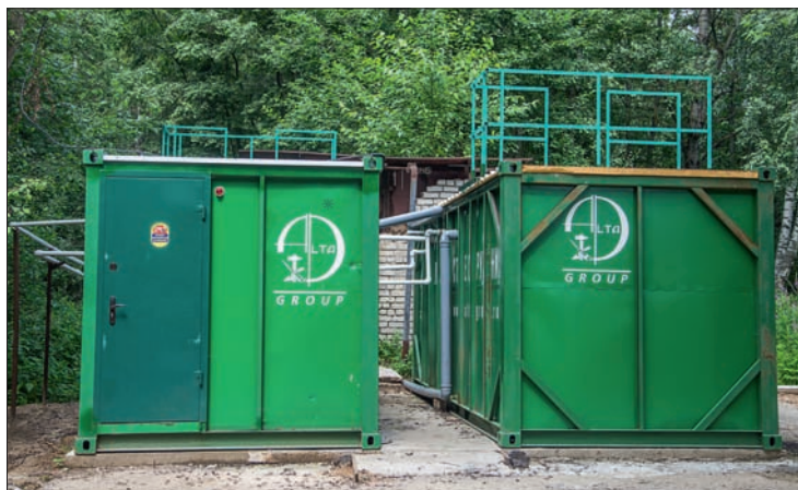
Рис. 2. Внешний вид мобильного очистного сооружения

Обслуживание системы также не требует дополнительных расходов. Очистное сооружение имеет удаленную систему управления, доступ к которой происходит через Интернет. Присутствие специалиста при обслуживании станции сведено к минимуму, например: мешок с отработанным илом необходимо менять раз в полгода. Мониторинг, диагностика и анализ работоспособности осуществляются дистанционно (рис. 4).