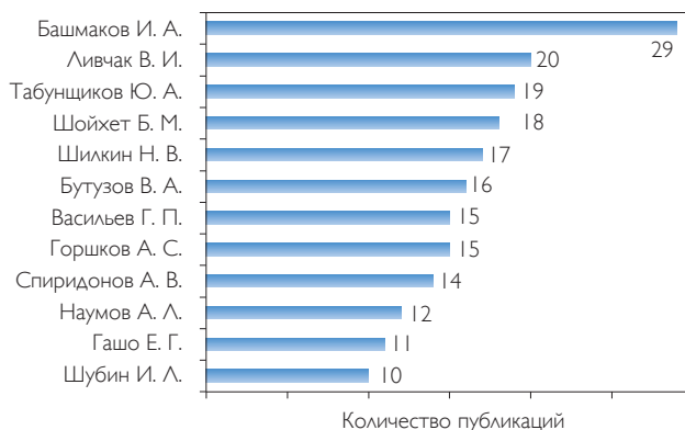
Рис. 2. Распределение публикаций по авторам

Для определения этого на первом этапе журнал относится к одному из нескольких тематических направлений (это необходимо для учета определенных различий