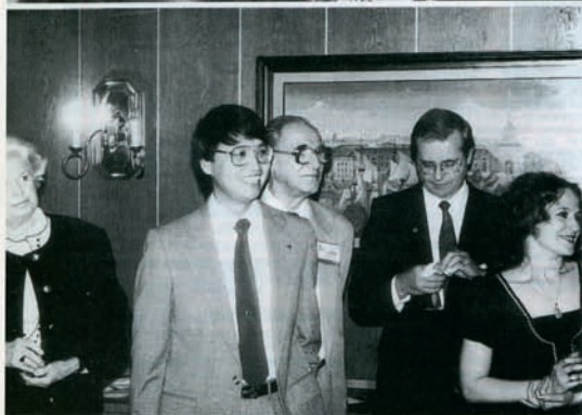
На Президентском приеме