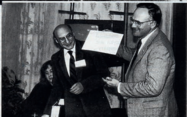
Вручение диплома члена АВОК Президенту ASHRAE Д. Говану

К сожалению, наши успехи являются одновременно и нашими поражениями: огромная востребованность книг из серии «Техническая библиотека АВОК» и стандартов АВОК породила широкомасштабное незаконное тиражирование: от Калининграда до Хабаровска нашу литературу выкладывают в Интернет для