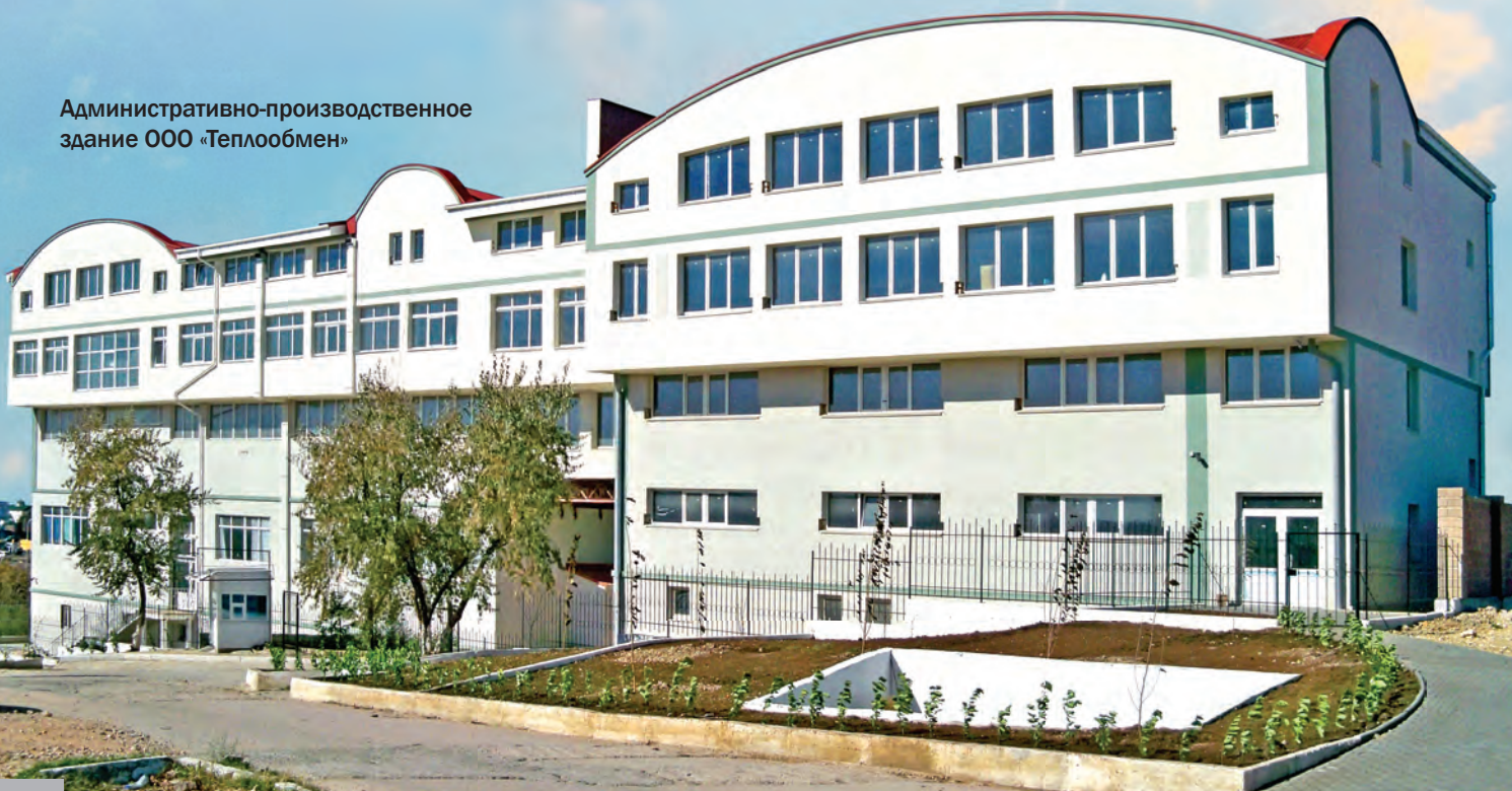
Административно-производственное здание ООО «Теплообмен»

При проектировании и на стадии строительства обоих зданий, одно из которых административно-производственное, а второе – коттеджного типа, ставилась задача применить на каждом объекте как можно больше легких реализуемых, общедоступных и экономически обоснованных энергосберегающих решений. Подход к данным энергосберегающим объектам был абсолютно прагматичным и не преследовал цели демонстрации возможностей перспективных методов энергосбережения, поэтому были исключены из рассмотрения безусловно энергосберегающие, но не всегда на сегодня экономически оправданные решения: использование энергии ветра или солнечной радиации для получения электроэнергии, а также тепловых насосов для отопления и обеспечения горячего водоснабжения, тем более в условиях каменистого грунта и отдаленности объектов от водных массивов.