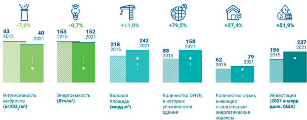
Рис. 1. Основные тенденции в области строительства зданий и сооружений в мире в 2015 и 2021 году [2]

Базовым нормативным правовым актом, регламентирующим аспекты энергоэффективности зданий, строений, сооружений, является Федеральный закон от 23 ноября 2009 года № 261-ФЗ «Об энергосбережении и о повышении энергетической эффективности и о внесении изменений в отдельные