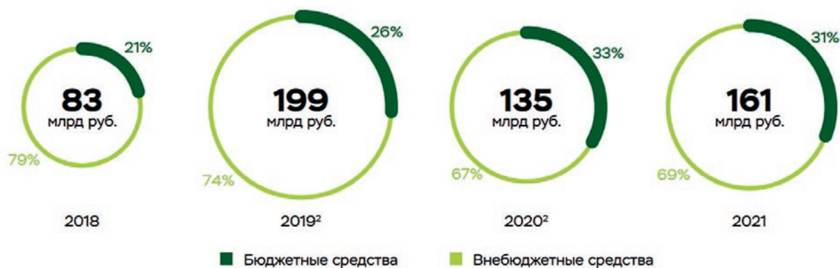
Рис. 2. Динамика объемов финансирования региональных программ в области энергосбережения и повышения энергетической эффективности в России за период 2018–2021 годов [3]

законодательные акты Российской Федерации» (далее – закон № 261-ФЗ). Согласно данному закону, энергетическая эффективность представляет собой характеристики, отражающие отношение полезного эффекта от использования энергетических ресурсов к затратам энергетических ресурсов, произведенным в целях получения такого эффекта.