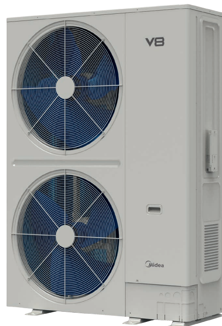
■ Серия V8S с горизонтальным выбросом воздуха

Атрибутом современной VRF-системы является работа с переменной температурой кипения и