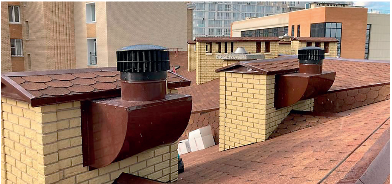
Рис. 3. Ротационные вентиляционные турбины, установленные в системе вентиляции многоквартирного дома

шахты средним возрастом дефлекторов ЦАГИ, установленных в период с 1960 по 1990 годы, можно считать 30 лет. То есть в период с 1960 по 1990 год проводились либо ремонт дефлектора, либо его замена, и аналогично с 1990 года по настоящее время. Таким образом, можно математически рассчитать проекцию количества подходящих к капитальному ремонту или замене дефлекторов ЦАГИ. В качестве примера на рис. 2 представлен нуждающийся в замене дефлектор ЦАГИ, и таких в стране миллионы; достаточно пройтись по улице любого города страны, чтобы убедиться в этом.