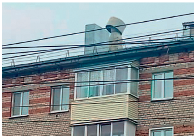
Рис. 2. Вышедший из строя дефлектор ЦАГИ

Согласно вышеприведенным статистическим данным, с учетом принятых сроков капитального ремонта систем вентиляции в зависимости от материала вентиляционной