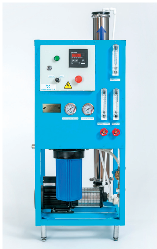
Рис. 4. Система обратного осмоса «Вагнер-125» производительностью 125 л/час

Чтобы обогатить «мертвую» воду до состояния «живой», на установку обратного осмоса устанавливаются специальные минерализаторы,