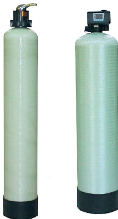
Рис. 1. Механический осадочный фильтр для очистки воды

Наряду с механическим один из самых старых и популярных методов очистки воды – сорбционный (рис. 2). В его основе лежит принцип химических реакций, которые происходят между