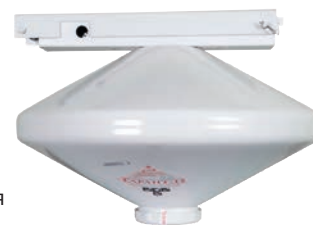
Рис. 2. Модуль порошкового огнетушения

В системах порошкового пожаротушения в качестве огнетушащего средства используется порошок, подающийся под давлением из баллонов в зону возгорания. Облако из порошка охлаждает участок возгорания, поскольку часть тепла передается частицам порошка, а энергия расходуется на их плавление. Кроме того, существенно уменьшается поступление кислорода к пламени и замедляется реакция горения (рис. 3).