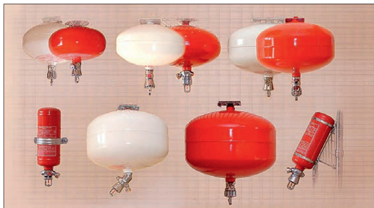
Рис. 1. Самосрабатывающие модули и огнетушители

Точно таким же образом единичный модуль пожаротушения с порошковым, газовым или аэрозолеобразующим веществом может выступать автономной установкой, если снабдить его детекторами факторов пожара и устройством запуска – подачи управляющего сигнала на выпуск ОТВ. Частным случаем самосрабатывающих модулей пожаротушения