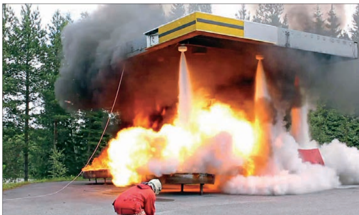
Рис. 3. Испытания порошковой АУПТ

Все порошки для тушения пожаров можно условно разделить на порошки общего назначения, используемые для тушения пожаров классов А, В, С, и порошки специального назначения, например, для тушения электроустановок, щелочных металлов, тушения лития и натрия и т.д.