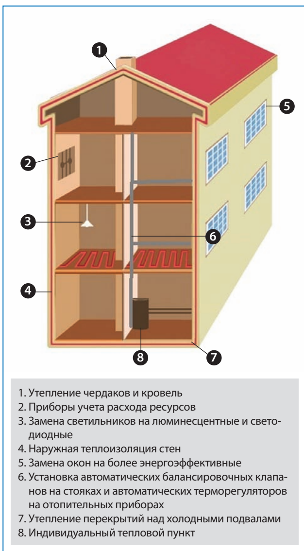
Рис. 2. Визуализация минимального перечня мероприятий по обеспечению повышения энергоэффективности зданий при капремонте

В целом состав минимального перечня схематически представлен на рис. 2.